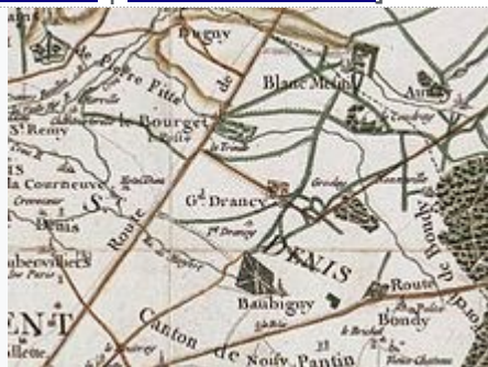
Carte de Cassini, Drancy (Grand et Petit Drancy) et ses environs vers 1780.

Les premiers écrits connus relatifs à Drancy remontent à la fin du XI e siècle, sous la forme d'une bulle du pape Urbain II qui confirme aux religieux de l'abbaye de Saint-Martin-des-Champs de Paris la possession de l'autel de Drancy. À l'époque médiévale, le petit village compte au XIII e siècle trois seigneuries : les seigneuries du Grand Drancy, du Petit Drancy (ou « des Noues ») et de Sainte-Geneviève.